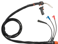
GXe 308WA (+GRe80)

300 A, с газовым охлаждением, 3,5 или 5 м, разъем Euro с Amphenol