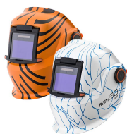
Beta Art e90A

Сварочная маска Beta e90X с автоматически затемняющимся сварочным светофильтром XA 47 обеспечивает надежную защиту глаз, лица и шеи при выполнении основных операций сварки и изготовления. Эта модель имеет легкую, но прочную конструкцию корпуса. Сварочная маска Beta e90X включает удобный головной бандаж, функцию GapView и рамку для увеличительной линзы.