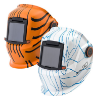
Beta Art e90P

Специальная версия популярных сварочных масок Beta серии e. Выберите один из двух уникальных вариантов дизайна: «Лес» отображает детали красивой северной сосны, а «Лед» – неповторимые детали морозного скандинавского пейзажа. Модель e90A имеет систему защиты глаз SA 60B с автоматическим затемнением, а также прочный и легкий корпус. Данная маска предлагает также удобный головной бандаж, функцию GapView откидной линзы и оправу для увеличительных линз.