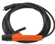
Welding cable 5 m 16 mm 2

Горелки Flexlite TX предназначены для использования со сварочными аппаратами TIG Kemppi. Ассортимент горелок включает несколько моделей шеек, эффективное охлаждение и легкий доступ к самым сложным стыкам.