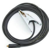
Earth return cable 25 mm 2 , 10 m