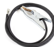
Earth return cable 25 mm 2 , 5 m